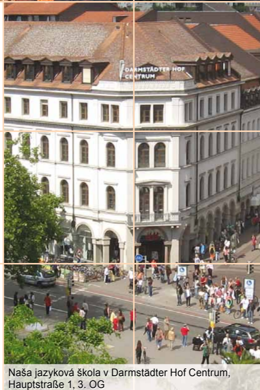
Naša jazyková škola v Darmstädter Hof Centrum, Hauptstraße 1, 3. OG